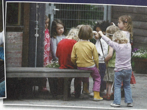
Kinder der Kita an der Fachschule für Sozialpädagogik (FSP2)